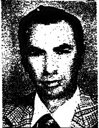
السيد عطالله : في الدرجة الاولى ثوبت المعلومات بين المنظمات الخفيفة حول النشاطات الكشفية لكل منظمة وعرض كل مثل لدى حبيبه عن نشاطات منظمته...